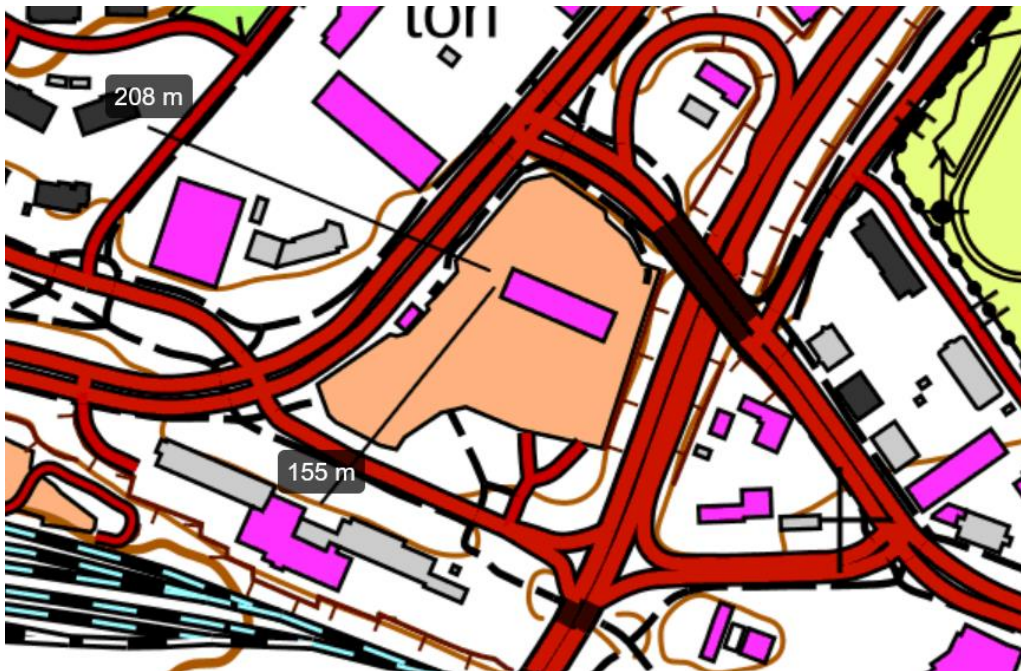
Kuva 2. Lähimmät häiriintyvät kohteet.